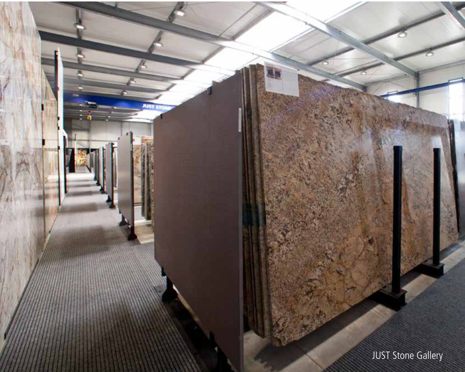
JUST Stone Gallery